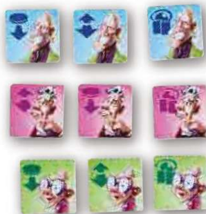
15 карточек обмана