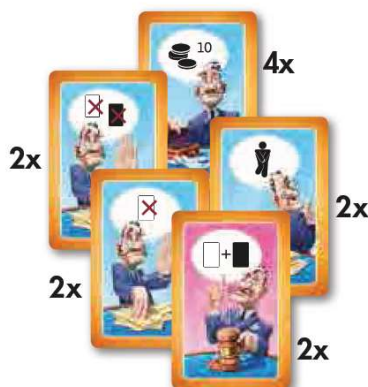
12 карточек аукционеров