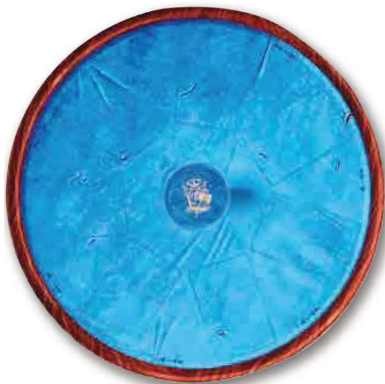
1 игровое поле