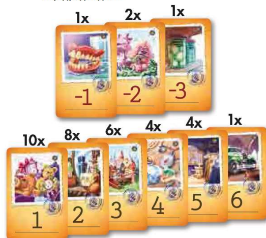
37 объектов аукциона