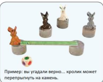
Пример: вы угадали верно... кролик может перепрыгнуть на камень.