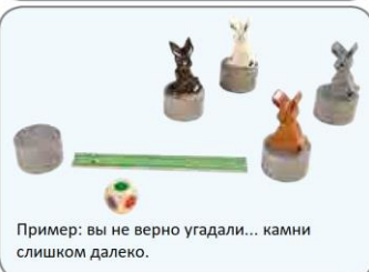
Пример: вы не верно угадали... камни слишком далеко.