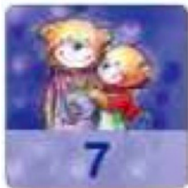
Карточка с цифрой

Здесь показано как представлено число «7» на карточках.