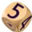
Кубик с цифрами

Каждый из этих кубиков представляет число «5»: