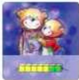
Карточка с веревочными счетами