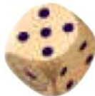
Кубик с точками