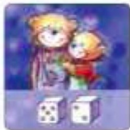
Карточка с точками