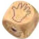
Кубик с пальчиками